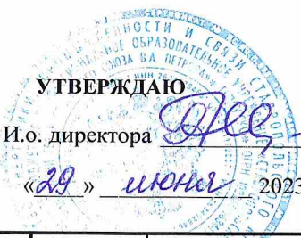
ГРАФИК УЧЕБНОГО ПРОЦЕССА НА 2023-2024 УЧЕБНЫЙ ГОД ЗАОЧНОЕ ОТДЕЛЕНИЕ